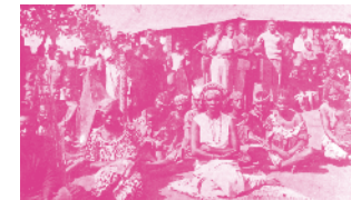
La Nakalamba, descendante de Mwata Yamvo, 1948

← La proclamation de Ruwej, peinture de Tshibumba, Lubumbashi, 1981