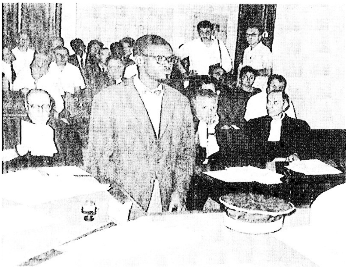
FIG. 2. Lumumba face au tribunal colonial, Congo belge (ph. Associated Press, in WILLAME 1990).