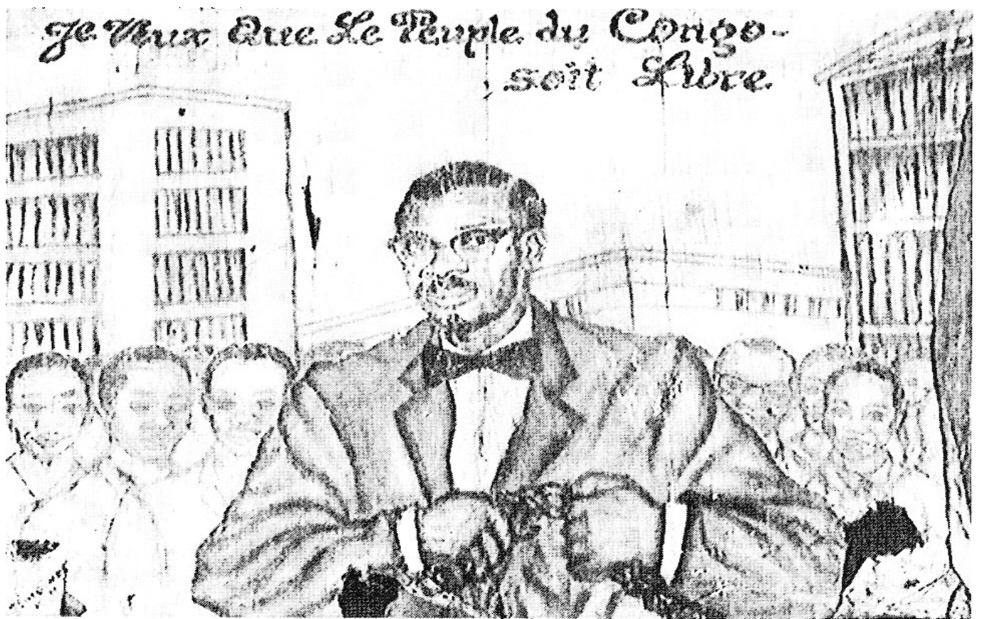
FIG. 1. Lumumba brisant ses chaînes (Tshibumba, Lubumbashi, 1972, coll. B. Jewsiewicki).