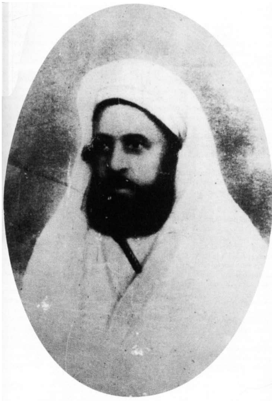
18.3. Le sultan Hasan I er (1873-1894).