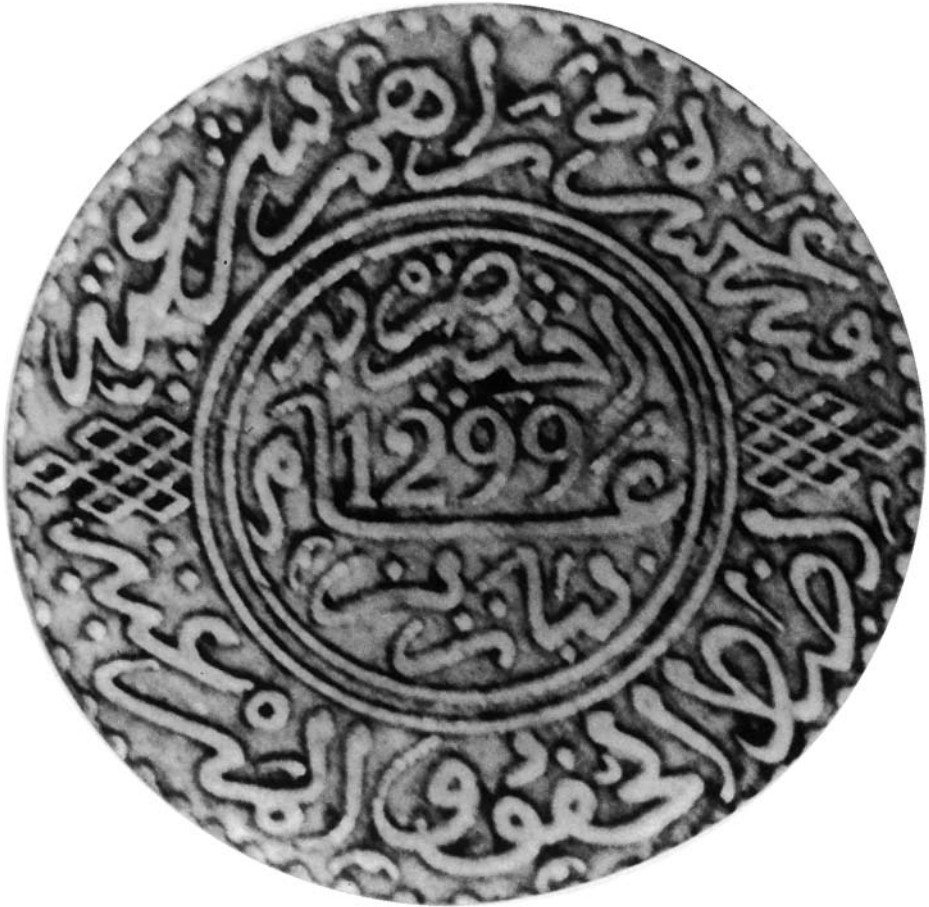
18.4. Rial d'argent frappé à Paris en 1881 pour Ḥasan I er .

[Source: A. Laroui, Les origines sociales et culturelles du nationalisme européen , 1977, Maspero, Paris.]