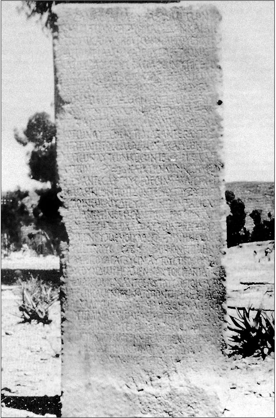
Inscriptions grecque d'Esana (IV e siècle de notre ère.)