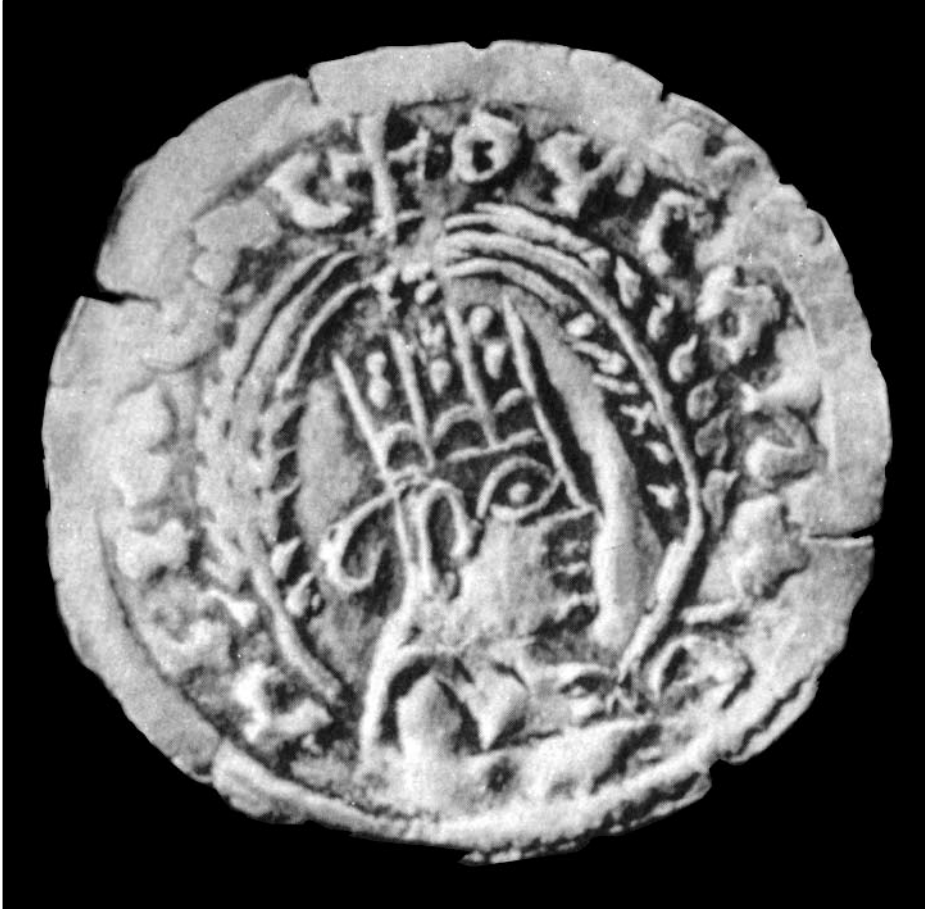
1. Monnaie en or du roi Endybis (III e siècle de notre ère).