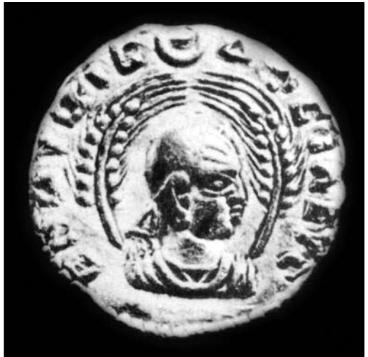
2. Monnaie en or du roi Ousanas.